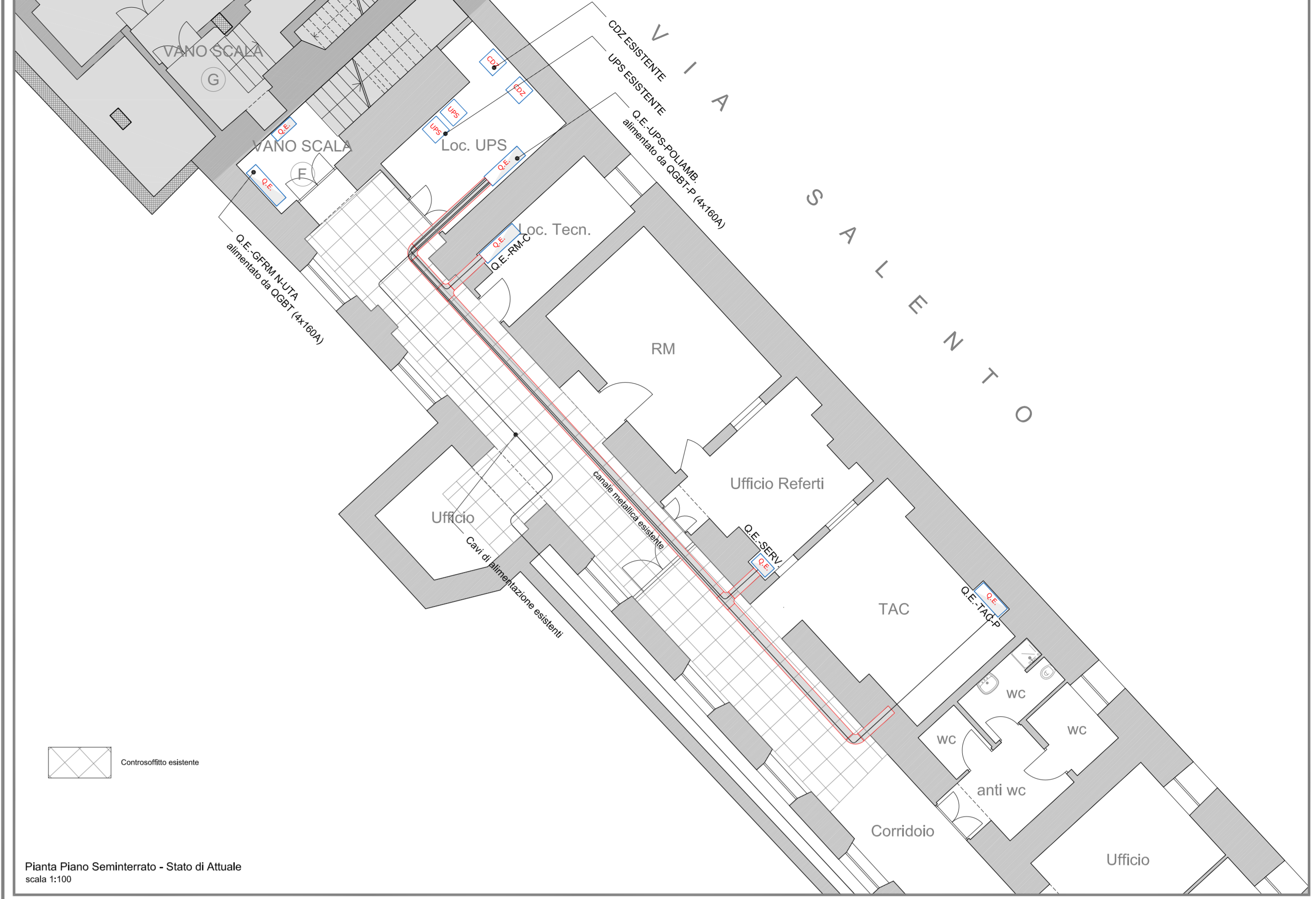
Pianta Piano Seminterrato - Stato di Attuale scala 1:100